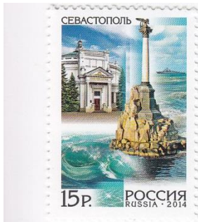
2014 Russia: Marken Sebastopol 19. Juni

Anfang 2014 führten Massendemonstrationen zum Sturz der pro-russischen Regierung der Ukraine. An ihre Stelle trat eine Regierung, welche Ukraines Zukunft in einer schrittweisen Annäherung an Europa sah. Als Gegenreaktion organisierte Russland pro-russische, auch militärische, Bewegungen auf der Krim und in der Ost- und Südukraine, welche letztlich zu einer Annexion der Krim und des Hafens Sevastopol durch Russland führten. Die Annexion wird international nicht anerkannt. Als Russland am 19. und 20. Juni 2014 neue Postwertzeichen mit den Abbildungen der Krim und Sevastopols herausgab, protestierte die Ukraine beim Weltpostverein UPU (siehe Circulaire No. 136/2014 seines Internationalen Büros) und kündigte an, Sendungen mit diesen Marken nicht zu befördern. So geschah es dann auch: derartige Sendungen wurden mit einem Aufkleber versehen ('Retour IB Circular No. 136 of 28.07.2014') und nach Russland zurückgeschickt. Sendungen des internationalen Postverkehrs, in die Krim adressiert und der ukrainischen Post übergeben, werden von dieser als nicht zustellbar (siehe UPU-Circulaire No. 71/2014 vom 28.04.2014) retourniert. Hierbei handelt es sich um einen Fall unterbrochener Postverbindungen, aber nicht um Postkrieg.