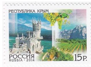
und Krim 20. Juni.