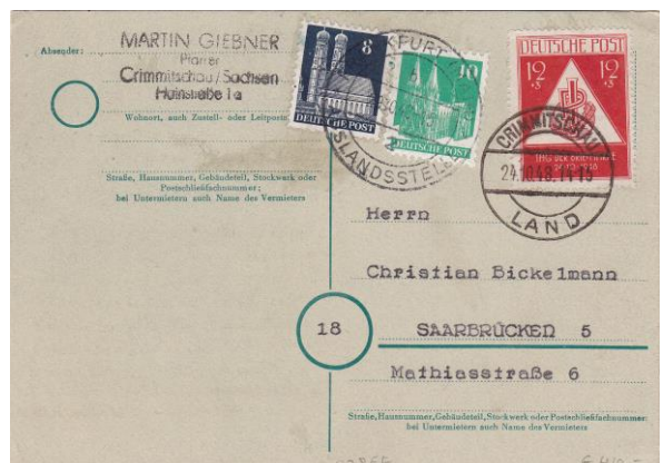
1948.19-NG in die BRD verklebte Zusatzfrankatur