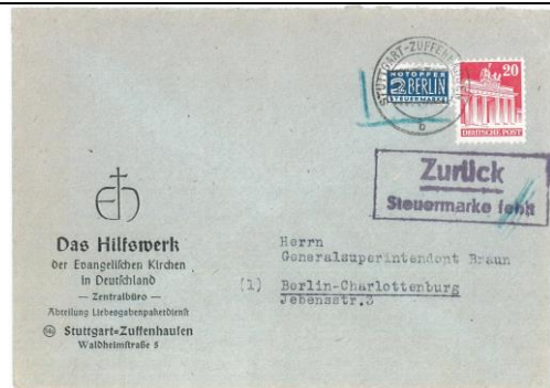
1949.22-Kb. XXIV "Zurück Steuermarke fehlt"