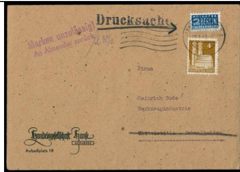
1949.22-B.XXIV "Marken unzulässig! An Absender zurück"