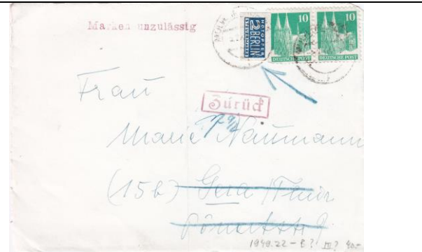
1949.22-B.XXV "Marken unzulässig" (Mit "n")