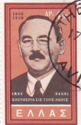
Griechenland: Imre Nagy