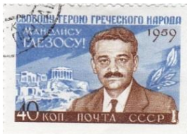
Sowjetunion: Manolis Glezos

Am 8. Dezember 1959 verausgabte Griechenland zwei Marken zu 4.50 und 6 Drachmen mit dem Bildnis des ehemaligen ungarischen Ministerpräsidenten Imre Nagy. Dieser war vom sowjetischen Militär während der Niederschlagung des ungarischen Volksaufstandes Ende 1956 abgesetzt und kurz darauf ermordet worden, weil er einen Reformkommunismus einführen wollte. Die Markenserie war ein Protest gegen eine von der UdSSR verausgabte Marke mit dem Bildnis des bekannten griechischen Kommunisten Manolis Glezos, der zu der Zeit im Gefängnis sass. Postalische Massnahmen Griechenlands gegen die Glezos-Marke sind nicht bekannt. Die sowjetische und die griechischen Marken wurden am 17. Dezember 1959 zurückgezogen, wodurch die griechischen nur 10 Tage gültig waren. Die ungarische Postverwaltung verwendete bei der Verweigerung von Sendungen den gleichen Aufkleber wie bei 1957-1.C.